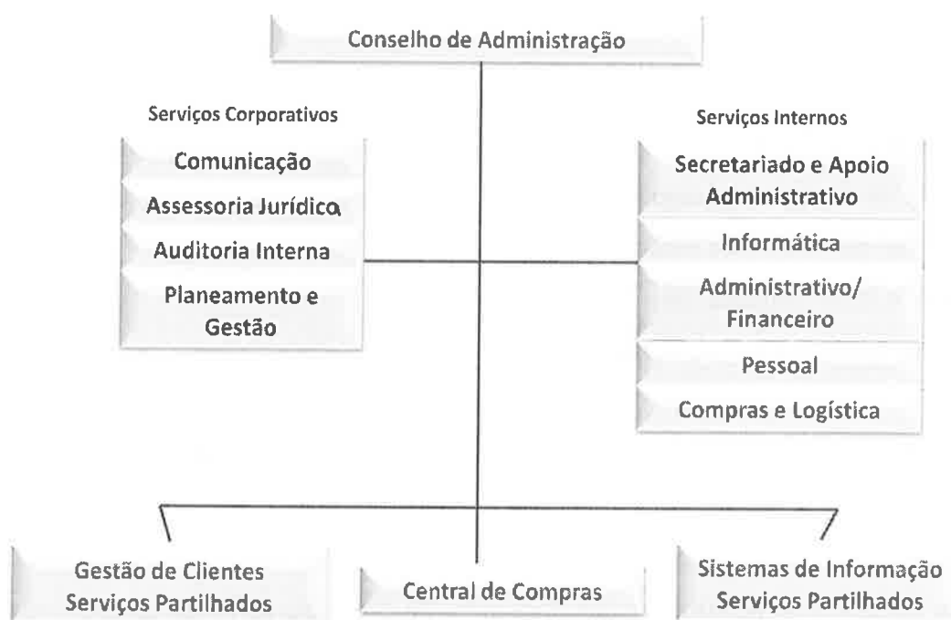
Figura 1. Organograma da SPMS, EPE

Os serviços internos fornecem serviços de suporte a toda a estrutura organizativa da SPMS.