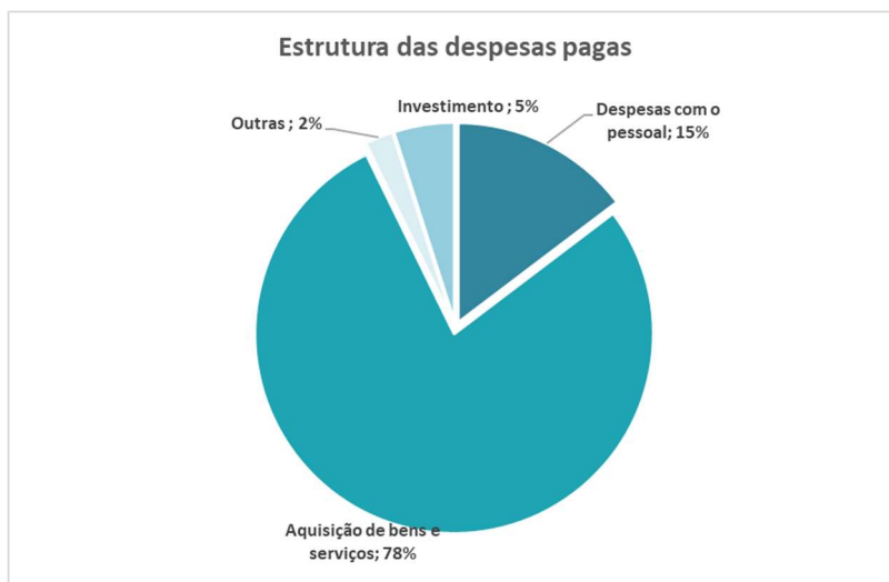
Figura 11 – Estrutura das despesas pagas

Na figura seguinte é possível verificar os valores pagos por agrupamento de despesa e respetivo peso relativo.