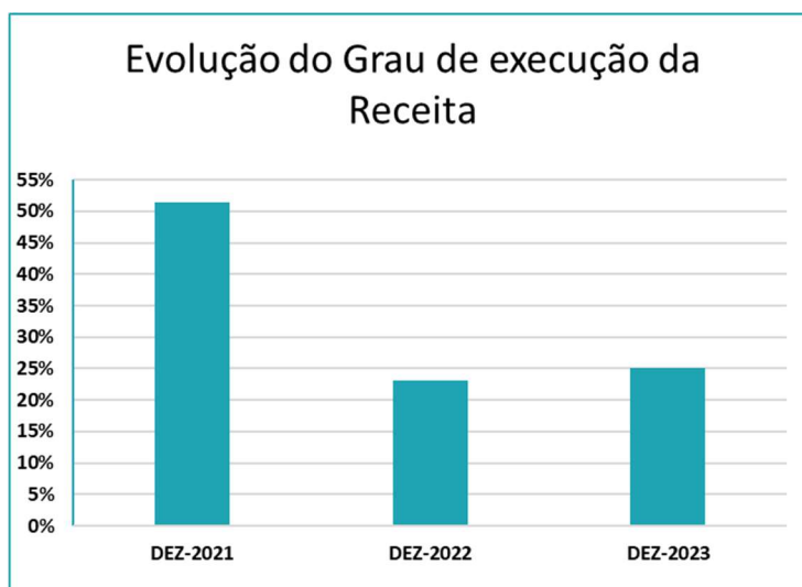
Figura 5 – Evolução do grau de execução da receita

Em relação à receita proveniente do Orçamento do Estado salienta-se o recebimento dos duodécimos das transferências de Receitas Gerais provenientes do OE, no montante de cerca de 36,8M€. Destaca-se também o recebimento de cerca de 24,4M€ referente ao Contrato Programa.